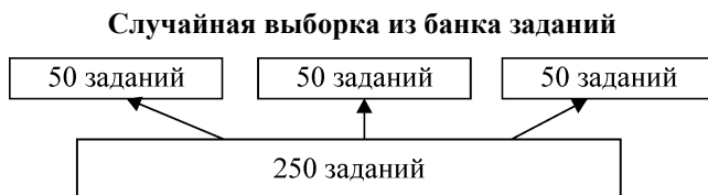
Рис. 2. Рекомендуемое соотношение численности заданий в банке и в варианте (минимальные требования)

повторяющихся заданий). Так как наличие менее 5-ти независимых вариантов создает слишком высокий риск «списывания» (у соседей по экзаменационной аудитории), численность банка должна быть не менее, чем в пять раз превышать минимальную численность варианта.